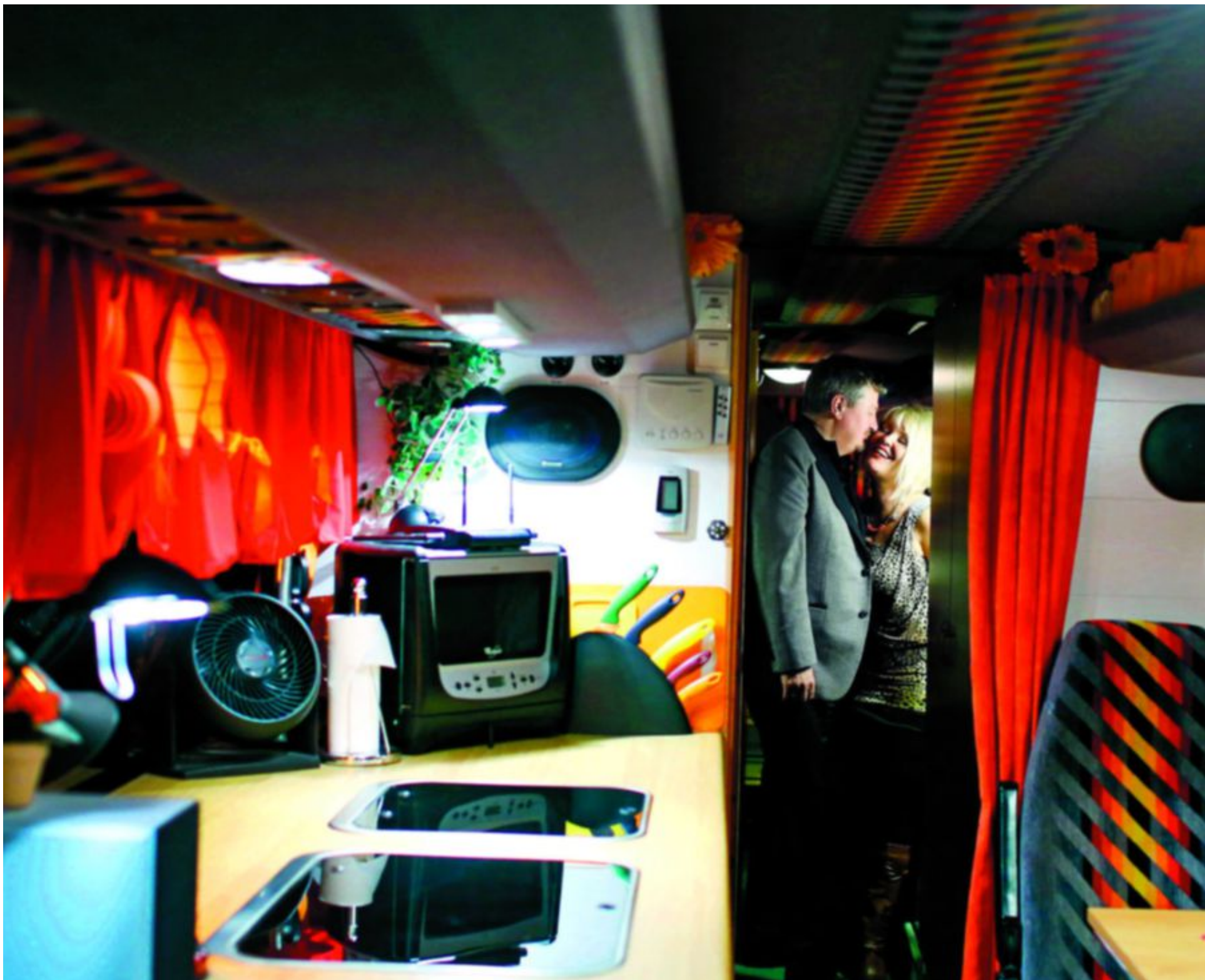
DU OG JEG. Ekteparet og duoen gjør alt sammen, og er så nære som to mennesker kan få bli. Kanskje like greit, siden bussen også fungerer som backstage.

L angt inn i tykkeste Finnskogen, forbi den nedlagte matbutikken og den ensomme campingvognen som er glemt i en grøftkant, opp tre glatte grusveier og midt under den isklare månen, forandrer fire blåkleddemusikkentusiaster et furuledd samfunnshus til et skikkelig danselokale. Men først: Ett tonn med sceneutstyr, noen timer i en ombygd buss og svensketopper på full guffe. Å være en svingende duo byr på mye musikk og mange merkelige sceneopplevelser, samt bussturer dit ingen kunne tru at musikkstjerner kunne bu.